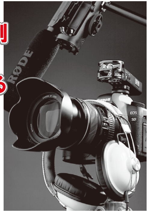
講座では、マイクやミキサーについての基礎知識も学べます。 また、講師特選の音響機材セットの紹介もあります。

会場:コメット東京本社4F 受講料:5800円(税込) 定員:各回30名(先着順・事前予約制) お申込:詳細は裏面をご覧ください。