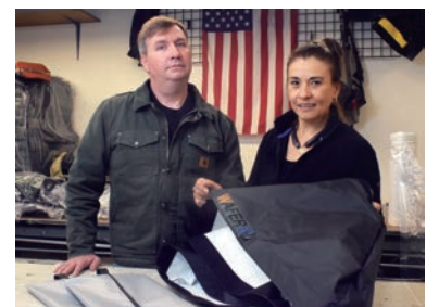
ブルーム USA 製造メンバー

ケニー・ロジャース、ドゥービーブラザーズ、ニッティグリッティ、ダートバンド、ジェファーソン・スターシップ等のアーティストの撮影に従事