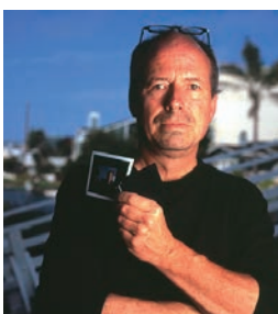
Autoportrait, Gary Regester, photographer

2017年、ボーエンズ社清算の為、製造中止となりましたが、復刻の要望が多いことから設計者であるギャリーのもとで『ウェーハー・リスタートプロジェクト』が開始され、米国100%製造のブルームウェーハーシリーズを限定モデルとして販売再開する運びとなりました。是非、歴史のあるライトバンクの光質で撮影してみてください！