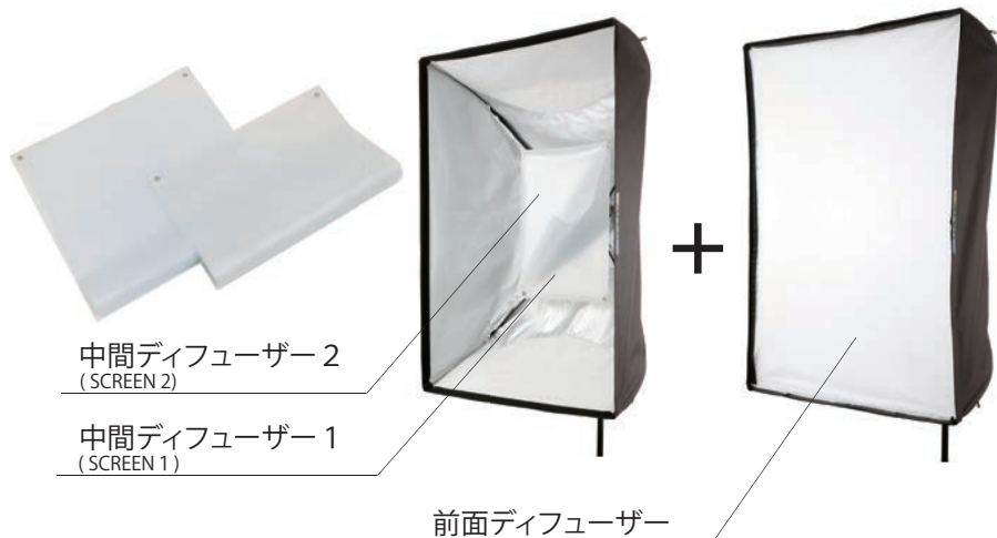
中間ディフューザー 2 (SCREEN 2)

中間ディフューザーには2枚の樹脂製の薄いフィルムに異なるドットパターンを印刷したものが付属されており、これがウェーハーの鍵となります。この、鍵となる中間ディフューザーと前面ディフューザーの組み合わせで光質の調整が可能となります。