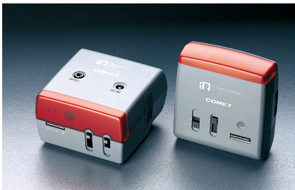
IR-R4a 赤外シンクロ受信器Ⅳa [032048] IR-T4a 赤外シンクロ発信器Ⅳa [032047]

シンクロコード不要の赤外線方式シンクロシステム 4ch対応で複数の撮影セットの独立シンクロが可能