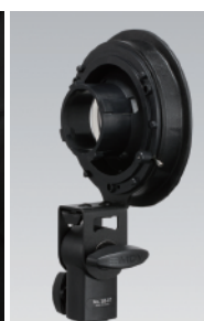
写真:SPEEDBOX A アルミRブラケットDm用

SPEEDBOX A アルミRブラケットDm用 【232729】JANコード 4582278087038 税込価格:14,300円 (本体価格:13,000円) ※Dm360/360TTL/B360HSS用