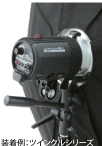
装着例:ツインクルシリーズ ※装着例は雲台ダボを取り外しております。