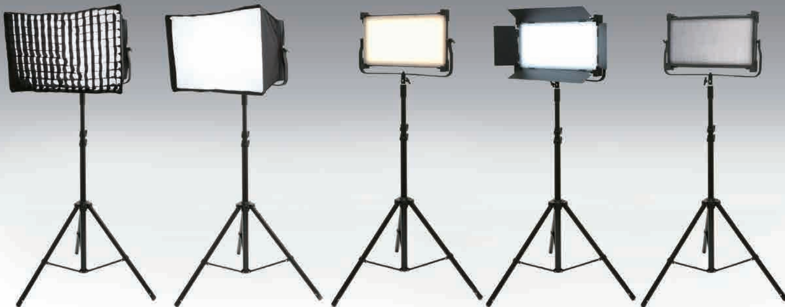
グリッド<<ソフトボックス用>>