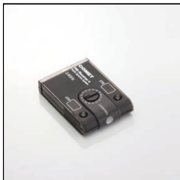
[232070] RS-Receiver II JANコード4582278086192 税込価格19,800円 (18,000円)