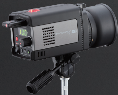
SYNCHRON 04 RC II