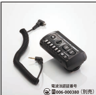
[232071] RS-Controller JANコード4582278086208 税込価格29,700円 (27,000円) 付属品:RS-Tシンクロコード