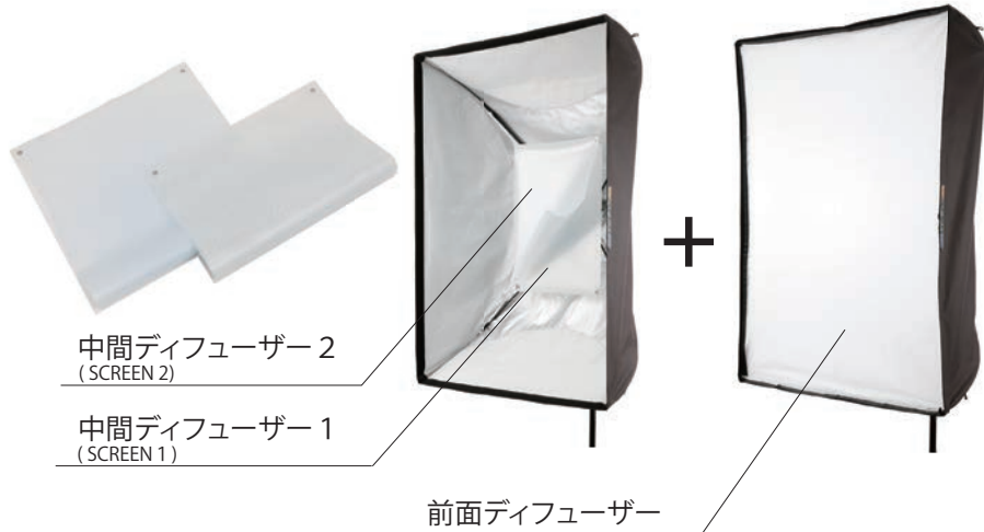
中間ディフューザー 2 (SCREEN 2)

中間ディフューザーには2枚の樹脂製の薄いフィルムに異なるドットパターンを印刷したものが付属されており、これがウェーハーの鍵となります。この、鍵となる中間ディフューザーと前面ディフューザーの組み合わせで光質の調整が可能となります。