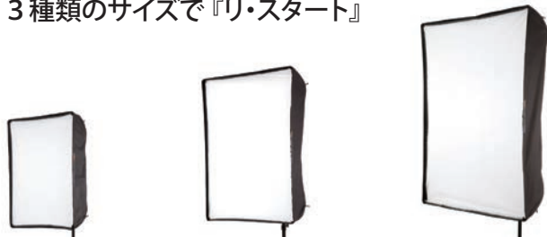
ブルームウェーハー75 【231240】 JAN 4582278087410