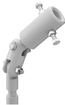
スウィングアダプター [142090]