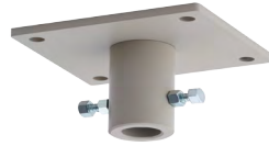
天井ダボ受金具II [122206] 高さ:66mm