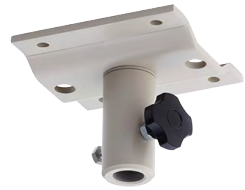
天井ダボ受金具II 回転式 [122208] 高さ:75mm