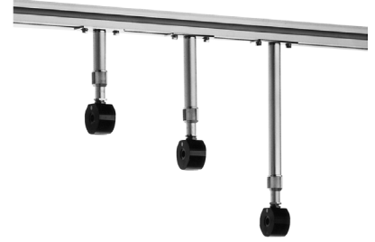
ハンガーポール A [142085] 105~154mm B [142086] 165~274mm C [142087] 285~514mm