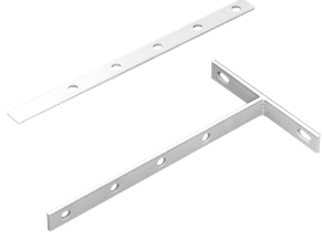
平型金具 [122254] T型金具 [122256]