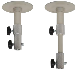
トップ取付金具 中 [122201] 高さ:170mm~250mm 大 [122202] 高さ:290mm~470mm 特大 [122203] 高さ:590mm~1065mm