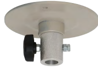
トップ取付金具 小 [122200] 高さ:60mm