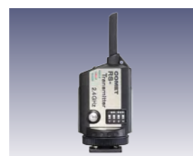
RS-発信器 [232025] (別売)

カメラに装着してシンクロ信号をRSミニレシーバーに送り、ストロボを発光させます。